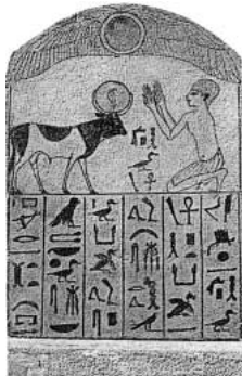
Un fedele, le mani levate in un gesto di adorazione, davanti al dio Api. Stele in calcare dipinto proveniente dal serapeum di Menfi. Egitto, XX dinastia, intorno al 1200 a.C. (Nuovo Impero)