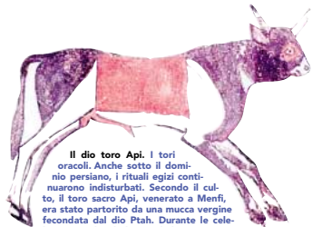
Il dio toro Api. I tori oracoli. Anche sotto il dominio persiano, i rituali egizi continuarono indisturbati. Secondo il culto, il toro sacro Api, venerato a Menfi, era stato partorito da una mucca vergine fecondata dal dio Ptah. Durante le celebrazioni a lui dedicate, il dio toro veniva fatto sfilare vestito di oro e adorato come un oracolo. Quando Api morì, gli egizi restarono in lutto per 70 giorni, tornando a gioire solo quando fu individuato il suo successore, rilevato da precisi colori del manto