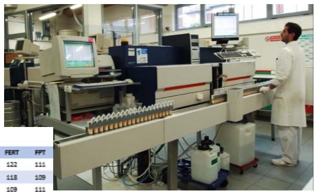
TOP 50 TORI GENOMICI ITALIANI PER gPFT